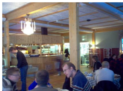
Lunchrestaurang i grannhuset