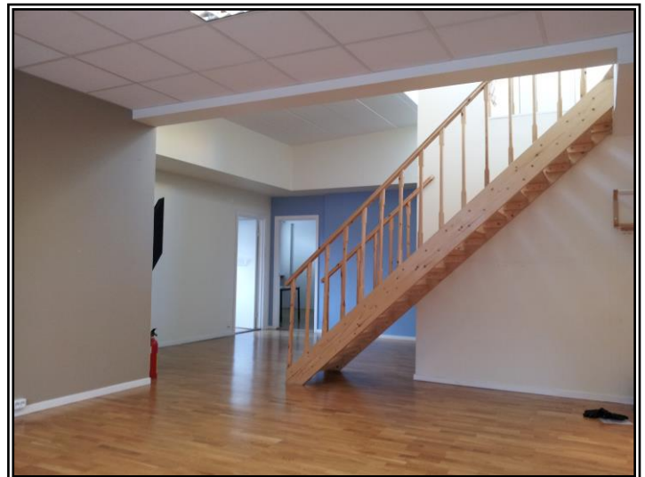
Öppna ytor. Pentry/fikarum en trappa upp.