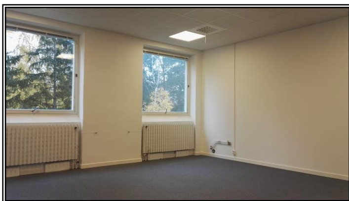
Mix av större och mindre kontorsytor.

På andra våningen finns lediga kontor i hög standard. Lätt för kunder och personal att parkera. Det är nära till butikerna, Willy´s, Södertälje Färghandel m fl. Lunchrestaurang finns på området. Tät buskommunikation med Södertälje Centrum och fjärrtågstation Södertälje syd. Promenadavstånd till Pendeltåget Södertälje Hamn.