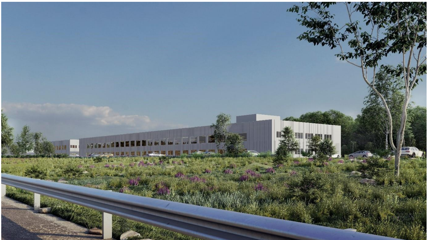
Vy från motorvägen E20