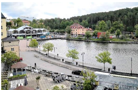
Utsikt mot Maren

Bästa läget i Södertälje med bra skyltläge och nära till Pendeltåget och bussar. Sjöutsikt mot kanalen. Variation av stora och lite mindre rum. Hiss finns. Nyrenoverat och bra ventilation.